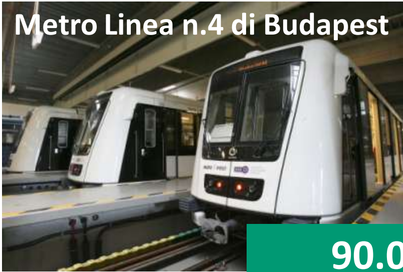
Metro Linea n.4 di Budapest