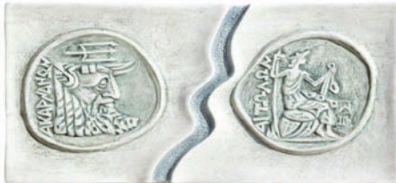
CHAMBER OF AETOLOAKARNANIA