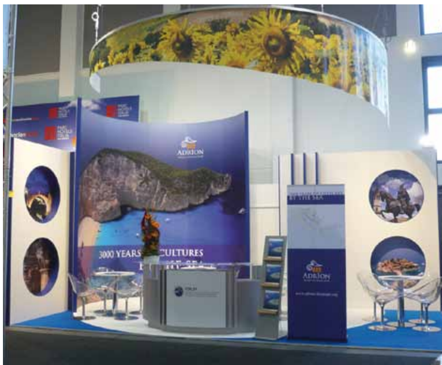
In alto: stand del Tavolo del Turismo del Forum Berlino, 10-14 marzo 2010

Nel 2011 si sono concluse le attività del progetto: importanti i risultati e gli output ottenuti