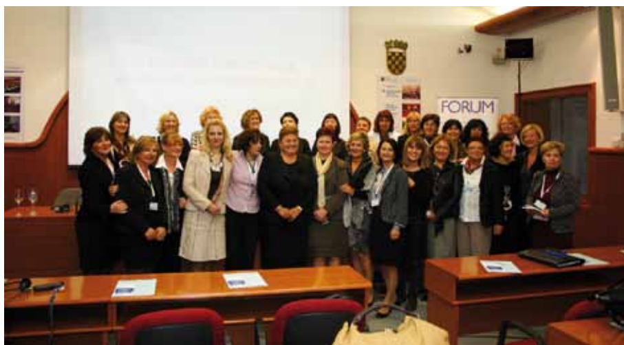
Le partecipanti al VI convegno delle imprese femminili (Spalato 3 e 4 novembre 2011)

A Spalato più di 100 imprese femminili dell'Adriatico e dello Ionio promuovono il networking