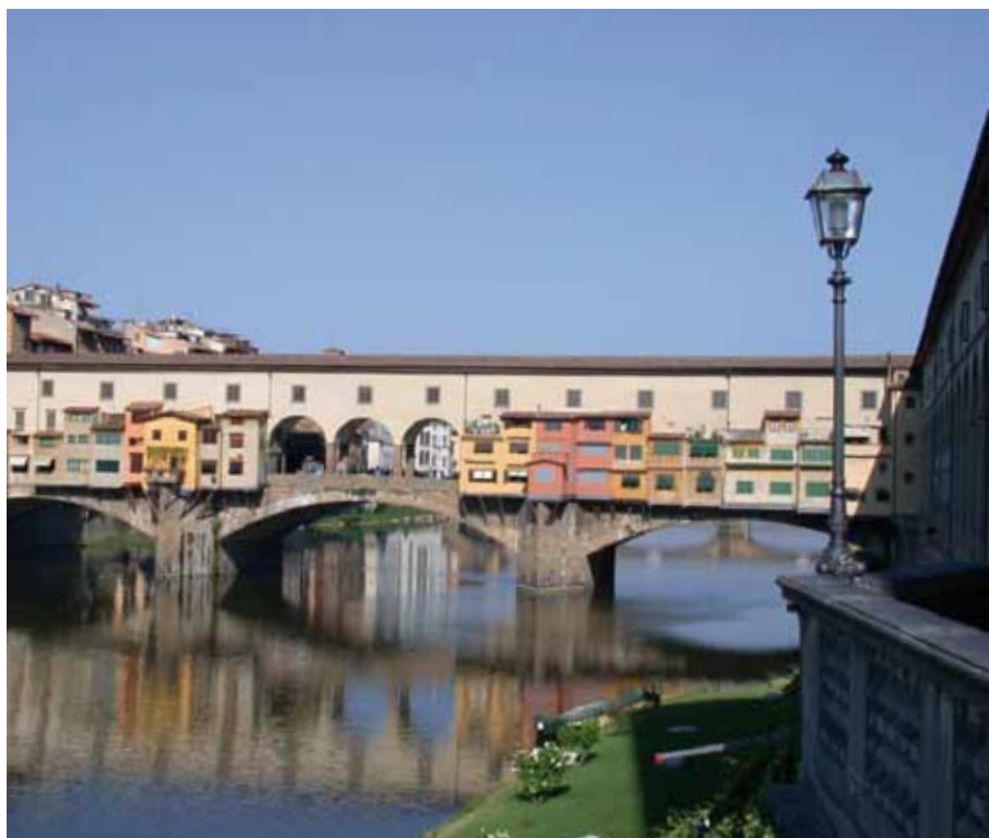
Firenze: Ponte Vecchio

Nuove opportunità per la promozione turistica dell'area adriatico-ionica