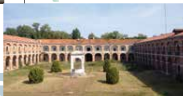
"Caserma Pepe" Lido di Venezia Ipotesi HUB-LAB Venezia