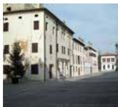
"Contrada Castello" Portobuffolè Ipotesi Hub-Lab Treviso

The ecomuseum instrument, as a whole, is articulated in fixed stations, visit paths and important reference structures which function as Access doors, that are the exhibition, information and teaching-laboratory basis for the experimentation and the participated conservation of the territory, and as venue for directional and research activities. The promotional routes depart from them and enable to reach the different visit points selected for the local area of interest.