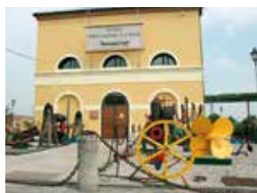
"Museo della Navigazione" Battaglia Terme Ipotesi HUB-LAB Padova